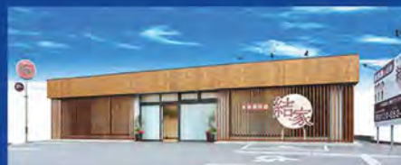
家族葬別邸 結家岡崎福岡 岡崎市福岡町字御堂山30-1

●事前相談・求人募集など、この広告に関するお問合せは下記フリーダイヤルへお気軽にお問合せ下さい。