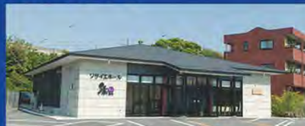
平安会館 ソサイエ 縁-えにしー 岡崎市大平町字大河内8