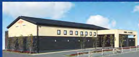
平安会館 ソサイエ 大平斎場 岡崎市大平町字大河内12-1