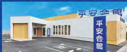
平安会館 六名斎場 岡崎市上六名3-12-6