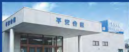
平安会館 ソサイエ 本宿斎場 岡崎市本宿西2-2-9