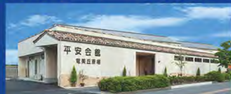
平安会館 竜美丘斎場 岡崎市明大寺町字大坂62-5