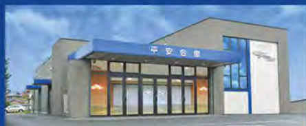
平安会館 新華苑 六ツ美斎場 岡崎市土井町字柳ヶ坪3