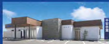
平安会館 百々斎場 岡崎市河原町1-1